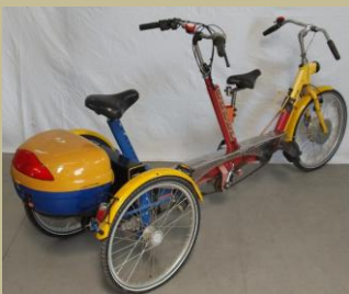
1224/Speciális elektromos tricikli 60e Ft-tól