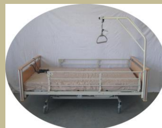
Speciális, extra széles 3 funkciós elektromos intenzív ágy 120e Ft-tól képek:970-972; 2569-2570