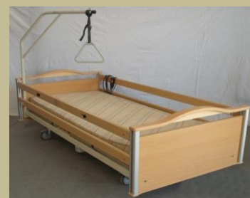
Speciális 3 funkciós elektromos intenzív ágy 120e Ft-tól