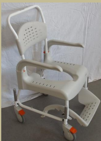
989-993/Műanyag kerekesszék, toalett szék 30e Ft-tól