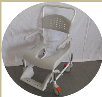
2610/Toalettre tolható toalett szék 30e Ft-tól