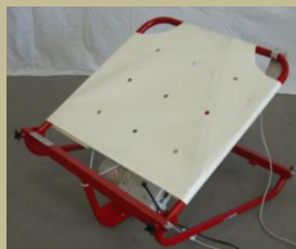
1029/ Ágyra szerelhető láb- és fejemelő (Elektromos) 6e Ft-tól