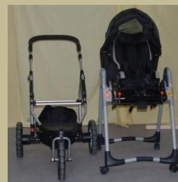
491/ Speciális többfunkciós gyerekkocsi 30e Ft-tól