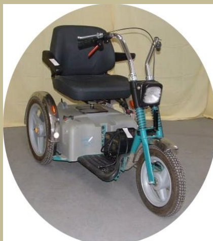
447/ Háromkerekű kormányos kocsi (Elektromos) 120e Ft-tól