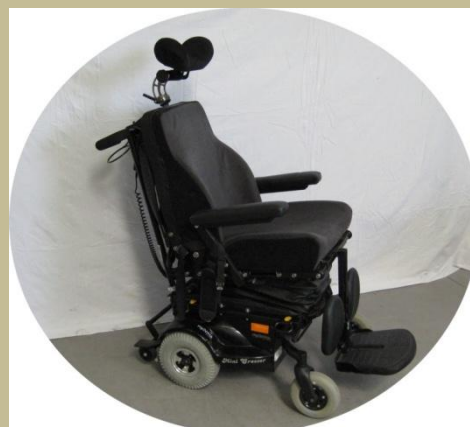
2713/ Segítő által irányítható elektromos rokkantkocsi 60e Ft-tól