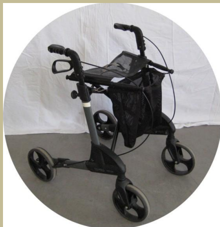
2526/Összecukható gurulós járókeret 6e Ft-tól