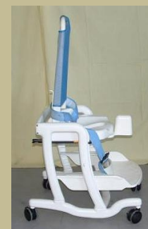
533/ Gurulós gyerekülés 9e Ft-tól