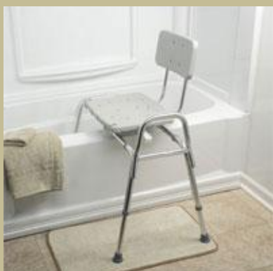
401/Zuhanyzóba helyezhető fix fürdetőszék 6e Ft-tól