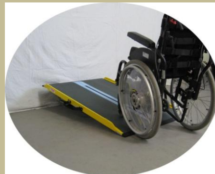
2784/Hordozható-összecsukható rámpa 60e Ft-tól