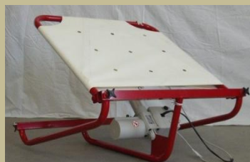
1032/ Ágyra szerelhető láb- és fejemelő (Elektromos) 6e Ft-tól