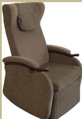
2492/Speciális szövethuzatú fektető-állító fotel 30e Ft-tól