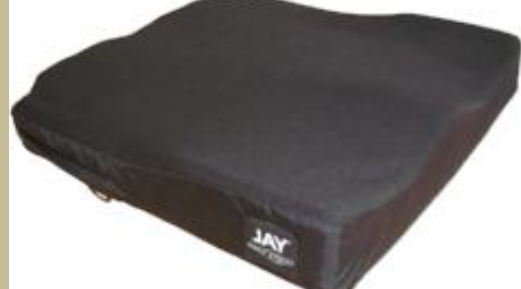
1073/Zselés, emlékezős ülőpárna (Antidecubitus/felfekvés elleni) 3e Ft-tól