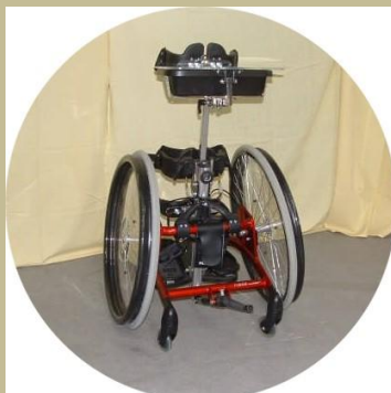
453/ Speciális betegállító 30e Ft-tól