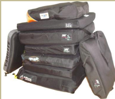
1062/Zselés, emlékezős ülőpárna (Antidecubitus/felfekvés elleni) 3e Ft-tól