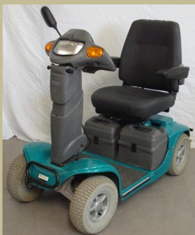
1295/ Négykerekű kormányos kocsi (Elektromos) 120e Ft-tól