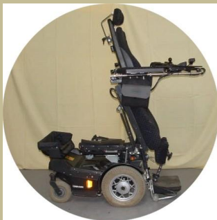
504/ Speciális elektromos betegállító 120e Ft-tól