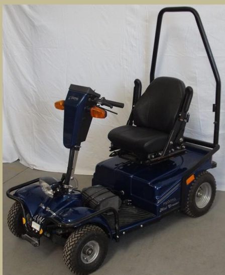
1307/ Négykerekű kormányos kocsi (Elektromos) 120e Ft-tól