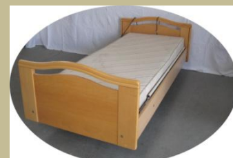
Speciális 3 funkciós elektromos intenzív ágy 120e Ft-tól (kapaszkodóval és oldalráccsal) képek: 2468-2477