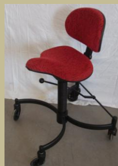
984/Speciális orvosi többfunkciós szék 6e Ft-tól