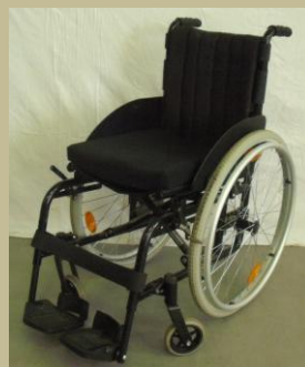
1143/Aktív kerekesszék (összecsukható, szétszerelhető) 30e Ft-tól