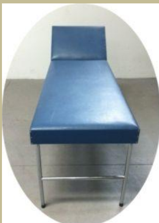
Speciális masszázstól fix lábakkal 30e Ft-tól kép: 547