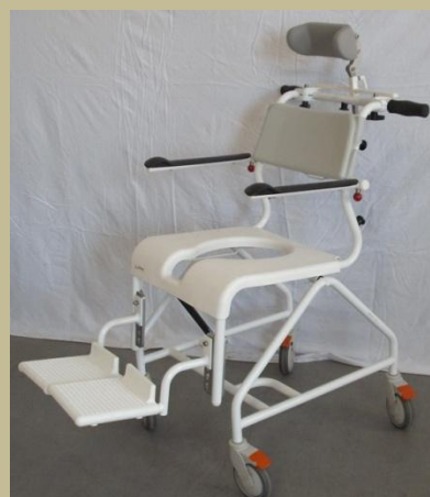
985-988/Műanyag kerekesszék, toalett szék 30e Ft-tól