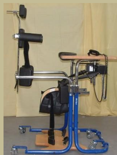
503/ Speciális betegállító 60e Ft-tól