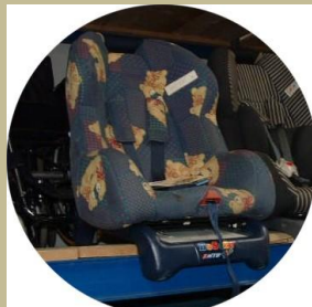
500 / Speciális gyerek autósülés 15e Ft-tól