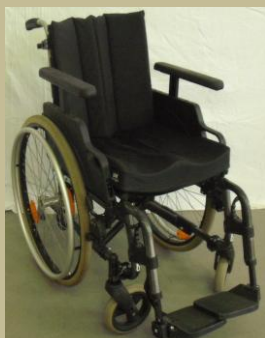
1147/Normál ápolási tolószék (összecsukható, szétszerelhető) 30e Ft-tól