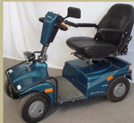
1282/ Négykerekű kormányos kocsi (Elektromos) 120e Ft-tól