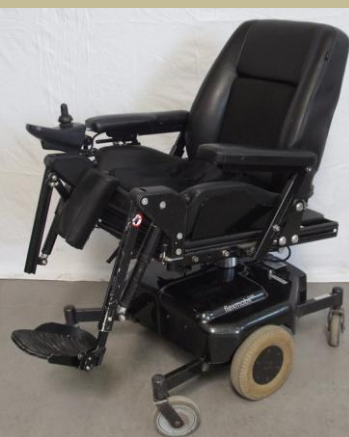
1239/Botkormányos elektromos rokkantkocsi 60e Ft-tól