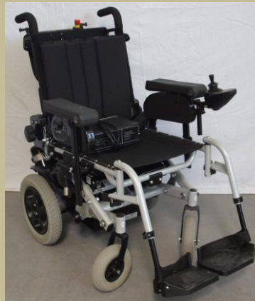
1267/Botkormányos elektromos rokkantkocsi 60e Ft-tól