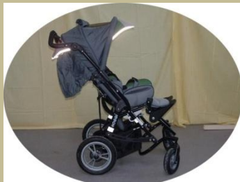
493/ Speciális többfunkciós gyerekkocsi 30e Ft-tól