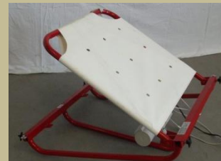
1031/ Ágyra szerelhető láb- és fejemelő (Elektromos) 6e Ft-tól