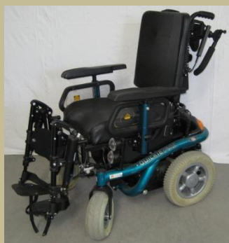
2749/ Botkormányos elektromos rokkantkocsi 60e Ft-tól