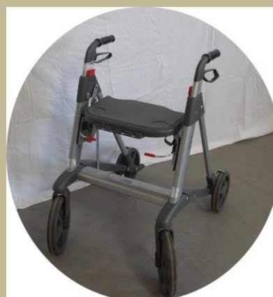
2509/Gurulós járókeret 6e Ft-tól