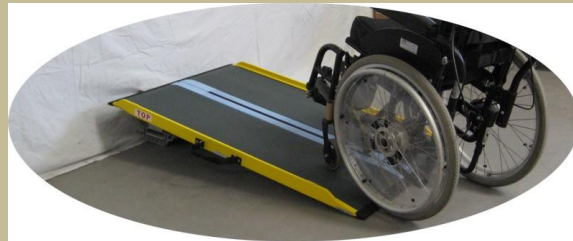
2785/Hordozható-összecsukható rámpa 60e Ft-tól