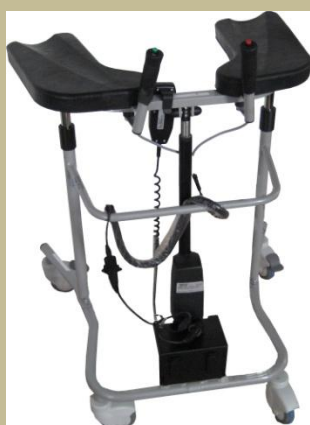
2533/Alkartámaszos elektromos gurulós járókeret 45e Ft-tól