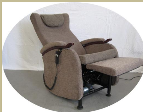
2499/Speciális szövethuzatú fektető-állító fotel 30e Ft-tól