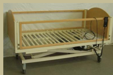
Speciális 3 funkciós elektromos intenzív gyerekágy 90e Ft-tól képek:1041-1044