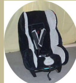
530/ Speciális gyerek autósülés 15e Ft-tól