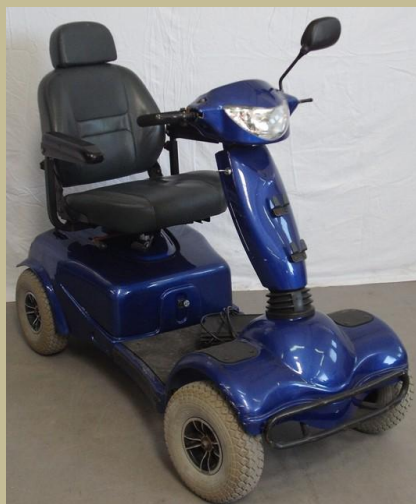
1285/ Négykerekű kormányos kocsi (Elektromos) 120e Ft-tól