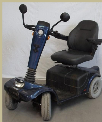
1290/ Négykerekű kormányos kocsi (Elektromos) 120e Ft-tól