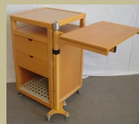
914/Normál kórházi éjjeliszekrény 15e Ft-tól