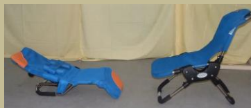
523/ Speciális gyerekültető 9e Ft-tól