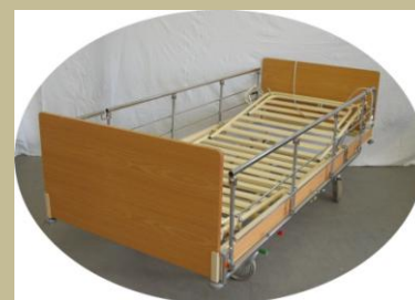
Speciális 4 funkciós elektromos intenzív ágy 120e Ft-tól (kapaszkodóval és oldalráccsal) képek: 1045-1049; 2450-2461