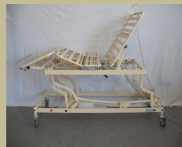
Speciális 3 funkciós elektromos masszírozó-gyógytornász vizsgáló ágy 60e Ft-tól