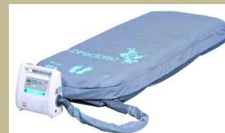
Légpumpás ágybetét (Antidecubitus/felfekvés elleni) 120e Ft-tól képek: 416-420