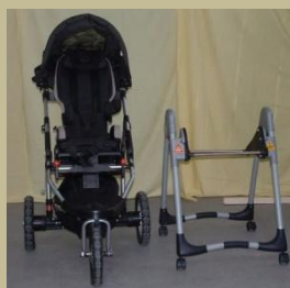
490/ Speciális többfunkciós gyerekkocsi 30e Ft-tól