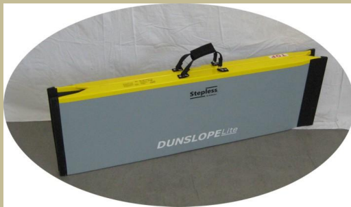
2782/Hordozható-összecsukható rámpa 60e Ft-tól