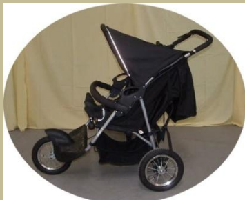
457/ Speciális gyerekkocsi 30e Ft-tól