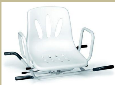
400/Fürdőkádra, kifordítós fürdetőszék 6e Ft-tól