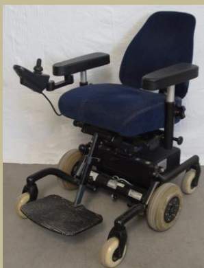
1261/Botkormányos elektromos rokkantkocsi 60e Ft-tól