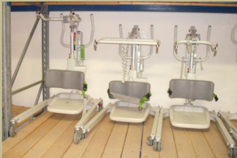
1228/ Speciális elektromos betegállító 60e Ft-tól