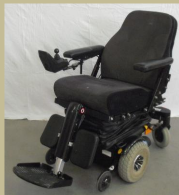
Botkormányos betegállítós elektromos rokkantkocsi 60e Ft-tól