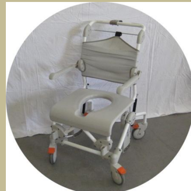
2615/Toalettre tolható toalett szék 30e Ft-tól