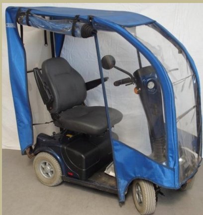
1228/ Zárt, kormányos kocsi (Elektromos) 150e Ft-tól