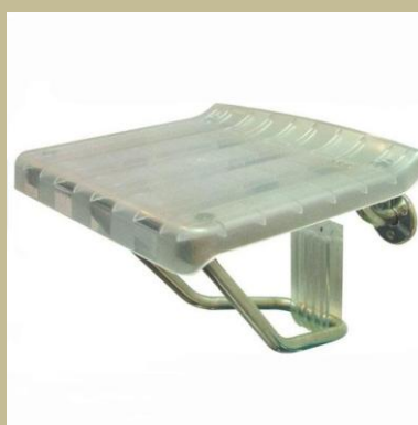
402/Zuhanyzóba falra szerelhető fürdetőszék 6e Ft-tól