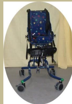
468/ Gurulós gyerekülés 15e Ft-tól