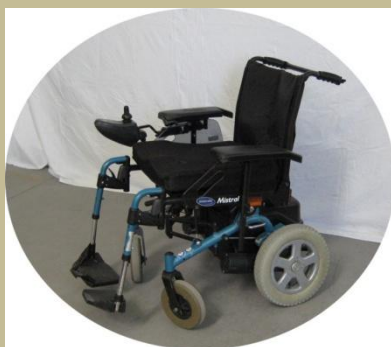
2773/ Botkormányos elektromos rokkantkocsi 60e Ft-tól