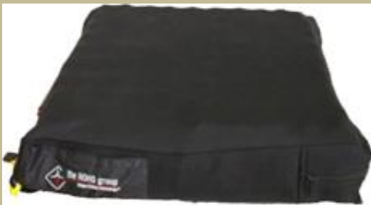
1063/ ülőpárna (Antidecubitus/felfekvés elleni) 6e Ft-tól