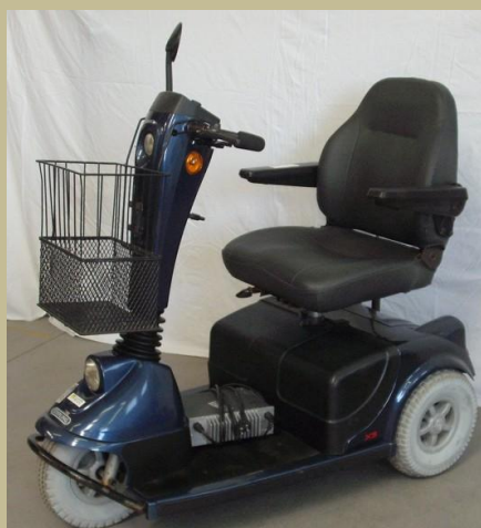
1302/ Háromkerekű kormányos kocsi (Elektromos) 120e Ft-tól