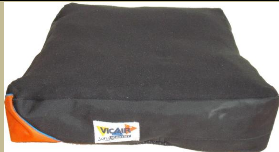
1081/ ülőpárna (Antidecubitus/felfekvés elleni) 3e Ft-tól