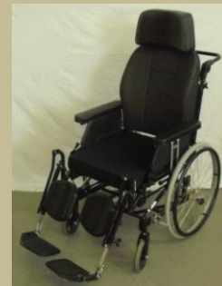
1106/Normál ápolási tolószék 30e Ft-tól