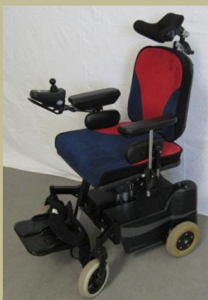
2759/Botkormányos elektromos rokkantkocsi 60e Ft-tól