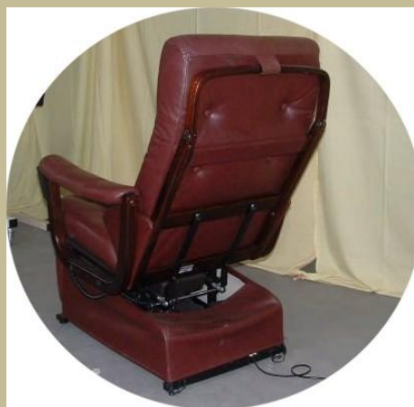
984/Speciális orvosi többfunkciós szék 60e Ft-tól