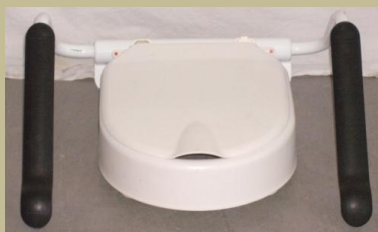
1022/Toalettre szerelhető karfás magasító fix 3e Ft-tól