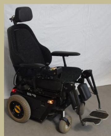
2672/Botkormányos elektromos rokkantkocsi 60e Ft-tól