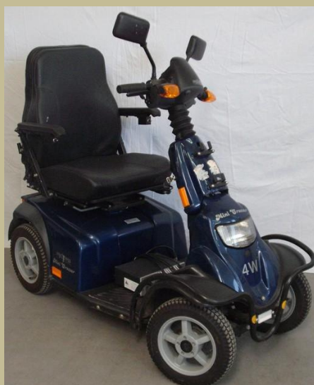
1311/ Négykerekű kormányos kocsi (Elektromos) 120e Ft-tól