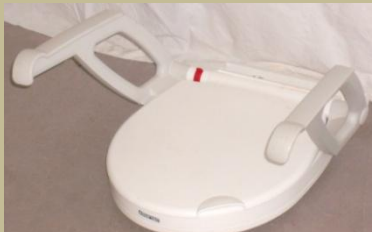
1028/Toalettre szerelhető karfás magasító fix 3e Ft-tól