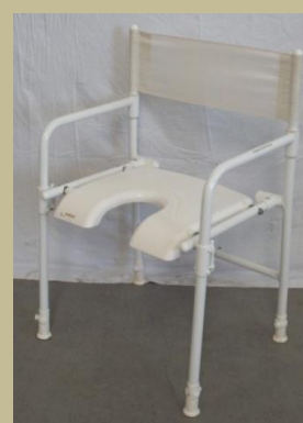
1335-1337/Összecsukható fürdetőszék 3e Ft-tól