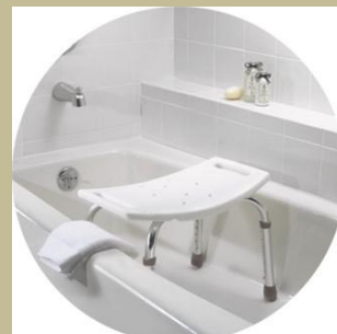
403/Zuhanyzóba, fix fürdetőszék 6e Ft-tól