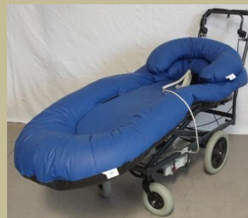
1213/ Felfekvés elleni fekvőbeteg hordozó (Elektromos) 60e Ft-tól