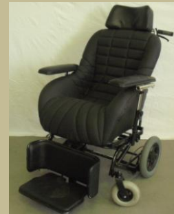
1129/Speciális ápolási tolószék 30e Ft-tól