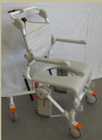
994-998/Műanyag tolószék, toalett szék 30e Ft-tól