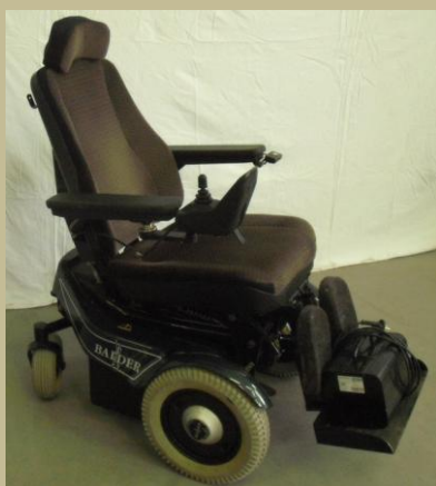
1158/Botkormányos elektromos rokkantkocsi 60e Ft-tól