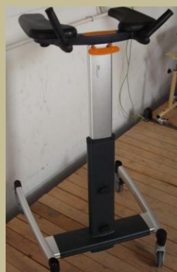
2534/Alkartámaszos gurulós járókeret 30e Ft-tól