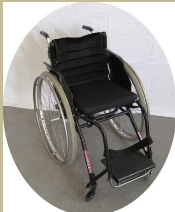
2550/Aktív kerekesszék 60e Ft-tól