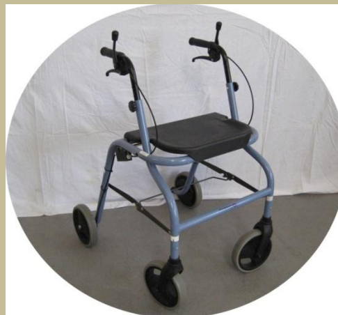
2507/Pihenő felülettel ellátott gurulós járókeret 6e Ft-tól