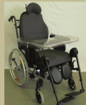
1120/Normál ápolási tolószék 30e Ft-tól