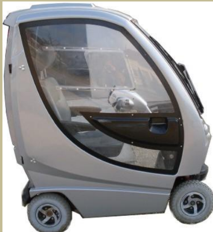
413/ Zárt, fűthető kormányos kocsi (Elektromos) 180e Ft-tól