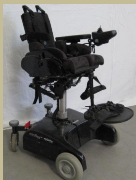
2768/ Botkormányos elektromos rokkantkocsi gyermekeknek 60e Ft-tól