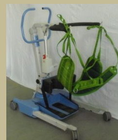
Speciális elektromos betegemelő OXFORD 60e Ft-tól (hevederrel) képek: 1002-1005; 2622-2625