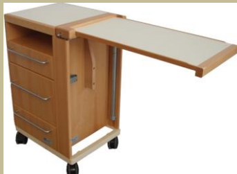
898/Speciális nemesfa éjjeliszekrény 15e Ft-tól