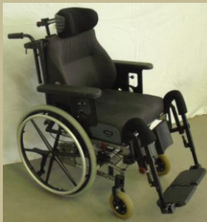
1110/Normál ápolási tolószék 30e Ft-tól