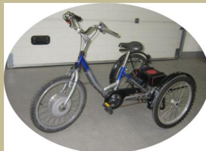
405/Speciális elektromos tricikli 60e Ft-tól