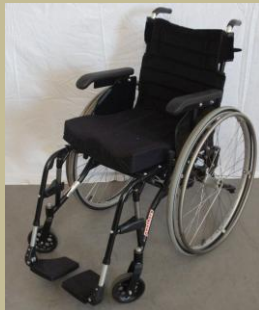
954/Normál tolószék 30e Ft-tól