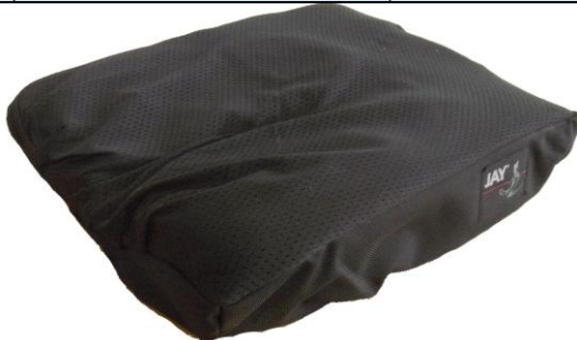
1087/Zselés, emlékezős ülőpárna (Antidecubitus/felfekvés elleni) 3e Ft-tól