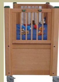
Speciális 4 funkciós elektromos intenzív gyerekágy 90e Ft-tól