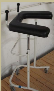
2530/Hónaljtámaszos gurulós járókeret 30e Ft-tól