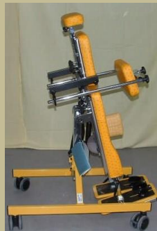
495/Speciális betegállító 30e Ft-tól