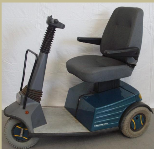
1320/ Háromkerekű kormányos kocsi (Elektromos) 120e Ft-tól