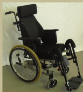
1127/Tolószék (összecsukható, szétszerelhető) 30e Ft-tól