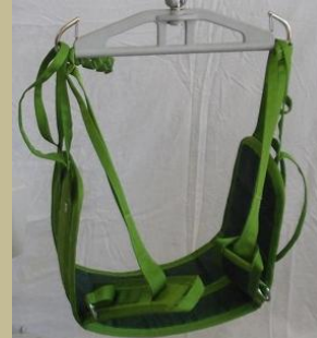
453/ Speciális betegállító heveder 6e Ft-tól