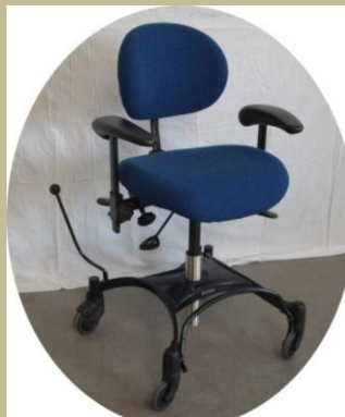
943/Speciális irodai többfunkciós szék 6e Ft-tól