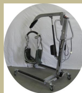
Speciális elektromos betegemelő SAMSON 60e Ft-tól (hevederrel) képek: 1015-1017; 2635-2638