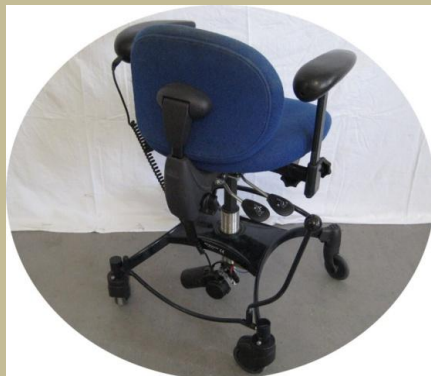
950/Speciális irodai többfunkciós szék 6e Ft-tól