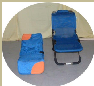
522/ Speciális gyerekültető 9e Ft-tól