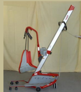
540/ Speciális betegállító 60e Ft-tól