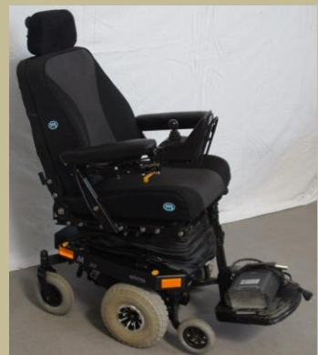
1232/Botkormányos betegállítós elektromos rokkantkocsi 60e Ft-tól