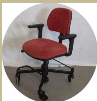
948/Speciális irodai többfunkciós szék 6e Ft-tól