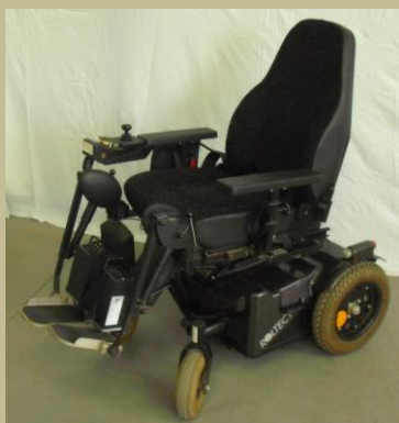
2773/ Botkormányos elektromos rokkantkocsi 60e Ft-tól