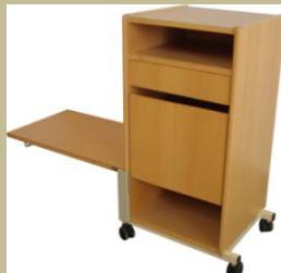
903/Különleges éjjeliszekrény 15e Ft-tól