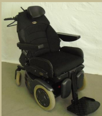
2768/ Botkormányos elektromos rokkantkocsi gyermekeknek 60e Ft-tól