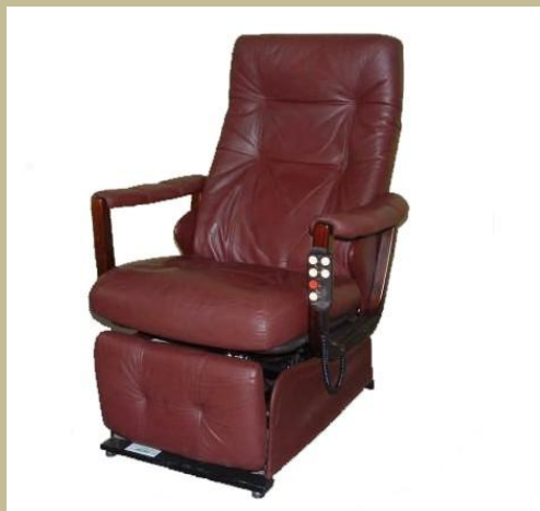
511/ Speciális bőrbevonatú fektető-állító fotel 60e Ft-tól