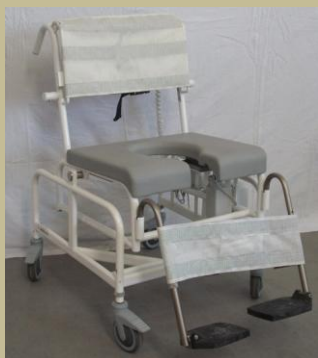
2862/Műanyag toalett kerekesszék 30e Ft-tól