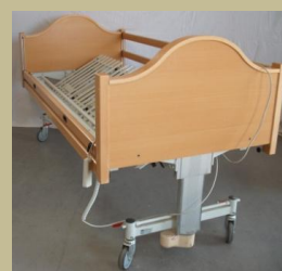
Speciális 7 funkciós elektromos intenzív ágy 150e Ft-tól képek:973-979; 2571-2578