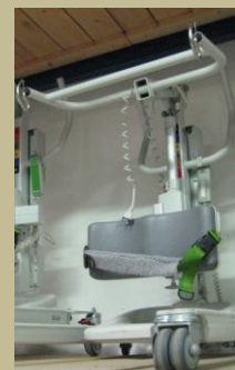
453/Speciális elektromos betegállító 60e Ft-tól