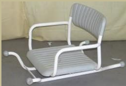
404/Fürdőkádra, fix fürdetőszék 6e Ft-tól