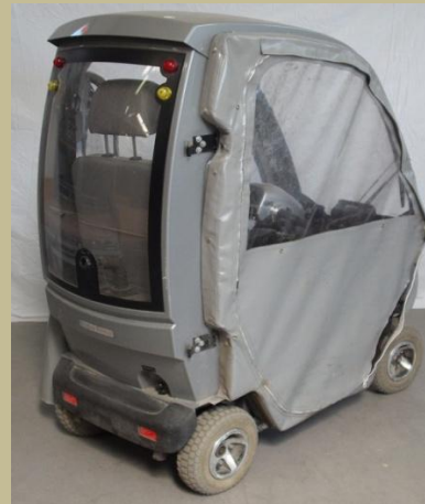
1219 Zárt, fűthető kormányos kocsi (Elektromos) 150e Ft-tól