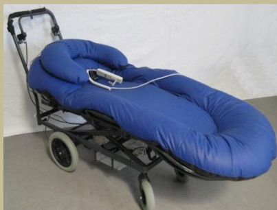
2746/ Felfekvés elleni fekvőbeteg hordozó (Elektromos) 60e Ft-tól