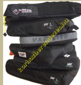
1056/Zselés, emlékezős ülőpárna (Antidecubitus/felfekvés elleni) 3e Ft-tól