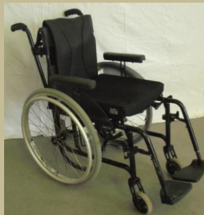
1101/Normál kerekesszék 30e Ft-tól