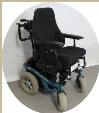
2717/ Segítő által irányítható elektromos rokkantkocsi 60e Ft-tól