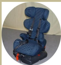
486/ Speciális gyerek autósülés 15e Ft-tól