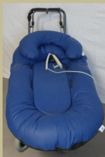
1211/ Felfekvés elleni fekvőbeteg hordozó (Elektromos) 60e Ft-tól