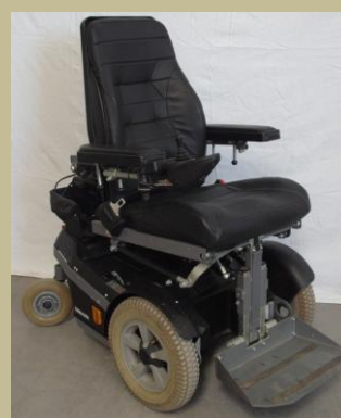
2765/ Botkormányos elektromos rokkantkocsi gyermekeknek 60e Ft-tól