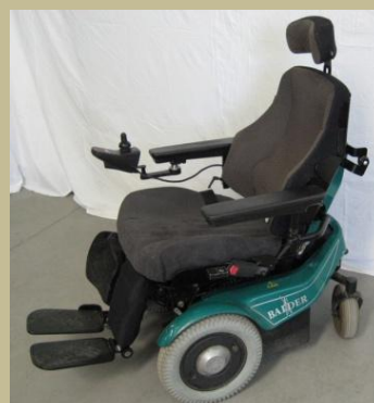
2765/ Botkormányos elektromos rokkantkocsi gyermekeknek 60e Ft-tól