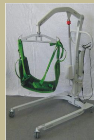
Speciális elektromos betegemelő LIKO UNO 90e Ft-tól (hevederrel) képek: 999-1001; 2616