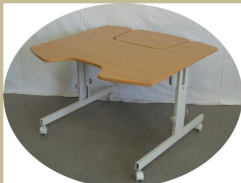
1092/Speciális számítógép asztal mozgássérülteknek 15e Ft-tól