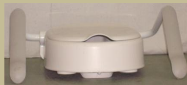
1025/Toalettre szerelhető karfás magasító fix 3e Ft-tól