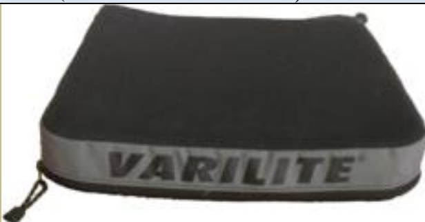
1065/ ülőpárna (Antidecubitus/felfekvés elleni) 3e Ft-tól