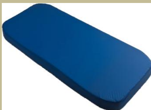
Szivacsmatrac ágybetét (Antidecubitus/felfekvés elleni) 90e Ft-tól

EZEKET A TERMÉKEKET CSAK EGYEDI MEGRENDELÉS ALAPJÁN SZEREZZÜK BE ILLETVE ÉRTÉKESÍTIJÜK! A BESZERZÉSI IDŐ AKÁR TÖBB HÓNAP IS LEHET MIVEL HASZNÁLT TERMÉKEKRŐL VAN SZÓ!