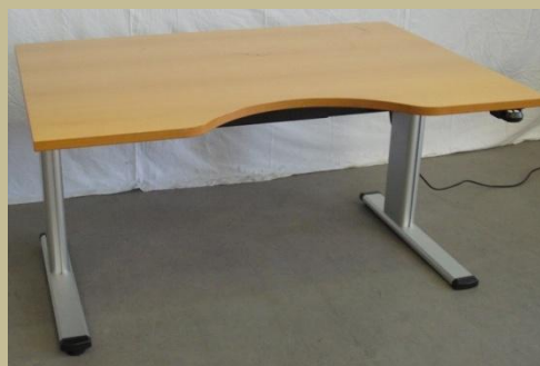
1054/Speciális elektromos íróasztal mozgássérülteknek 30e Ft-tól