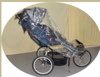
459/ Speciális gyerekkocsi 30e Ft-tól