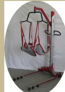
Speciális elektromos betegemelő MOLIFT 90e Ft-tól (hevederrel) képek: 1011-1013; 2631-2634