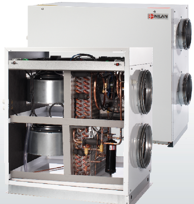
VPL 28 és 15