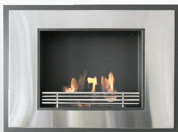
Kémény nélküli passzívház kandalló.